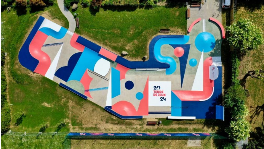
Skate-park - Pontoise (95)