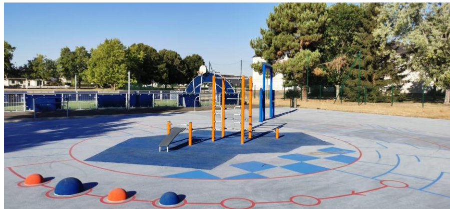
Aire de Fitness - Le Lude (72)